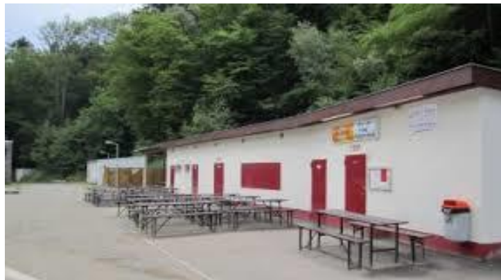
Le lieu du Jour